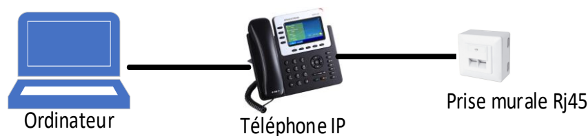
Figure 1 : Connexion d'un Téléphone IP et d'un ordinateur à une prise RJ45

Le prestataire devra fournir au moins deux cordons de brassage par prise RJ45 installée comme ci-dessous :